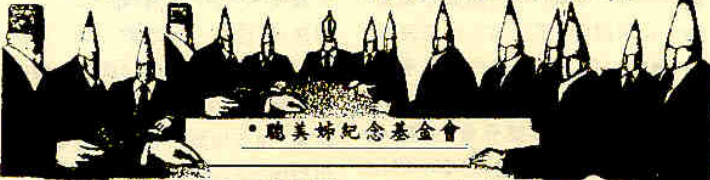
• 聽美姊紀念基金會

經過外來統治者「國語政策」年久月深ê洗腦，會曉講母語ê台灣囡仔愈來愈少。咱ê子弟若繼續闊失栽培，無機會接受台灣本土語文教育，免閣外久，咱祖先ê話就會在咱這代來失落。